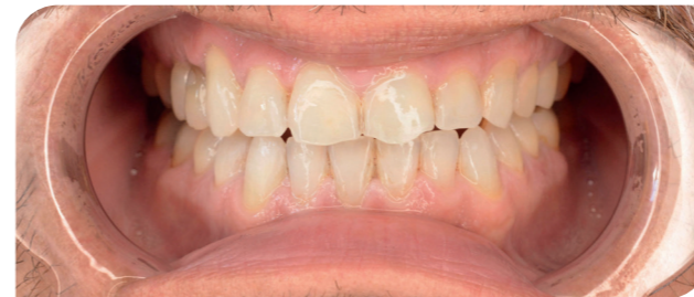
Nach 5 Monaten

Nach dem Tragen des letzten Aligners sorgt jetzt ein festsitzender Retainer dafür, dass seine Zähne dauerhaft an Ort und Stelle bleiben.